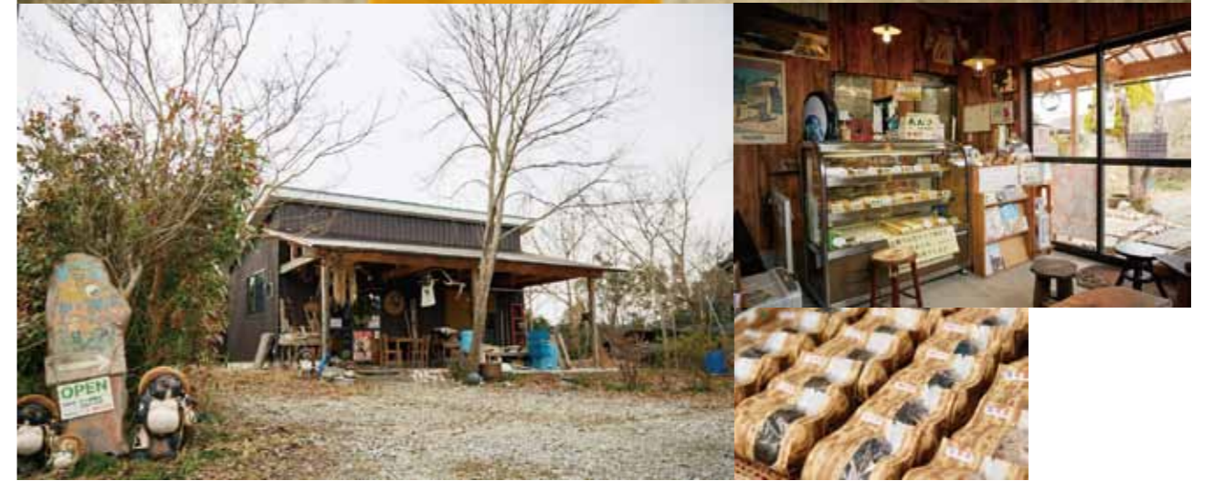
(上) 坂本さんの自宅前にて。(左下) 自宅の敷地に建てた店舗 (右上) 店内にはイートインスペースもあり。つくりたてのおにぎりが味わえます。「地域通貨使用できます」という看板も。(右下) イベントや委託販売用にパッケージされたおにぎり