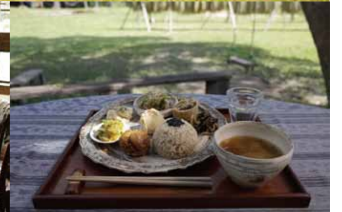
(上) お米の収穫時には全国から仲間たちが集まる。(左下) 毎日のごはんは、仲間たちと丸いテーブルを囲んで。(右下) カフェで提供するごはん。季節ごとにメニューが変わる。