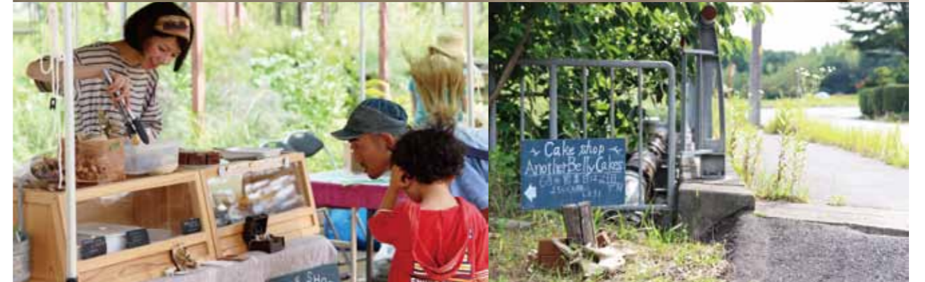
（上）旬のフルーツが載ったケーキたちは、色鮮やかでとっても美味しそう。（左下）マーケットで出店の様子（右下）月に一度だけ開く直接販売の日を前にして、工房前に掲げられた看板。意外に小さいのに、ちゃんとお客さんが集まる。